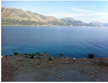
Objekti I orientuar me pamje nga deti