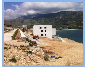
Pamja e objektit ne raport me vendin.