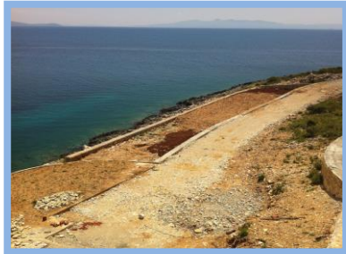
Pjesa e sherbimeve ne resort